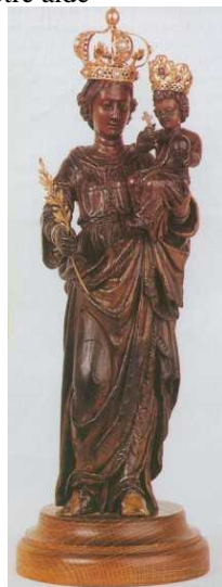
Notre Dame de la Paix